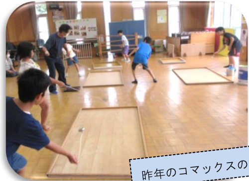
昨年のコマックスの様子