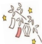
今年のたなばたかざり