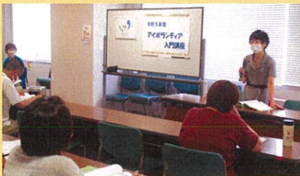
アイボランティア入門講座

音訳は聞き手が感じ取るものなので、感情を込めないで行いますが、朗読会では少し気分を乗せてお届けしています。朗読会は一般の方も対象なので音訳の読み方ではなく朗読風に行っています。